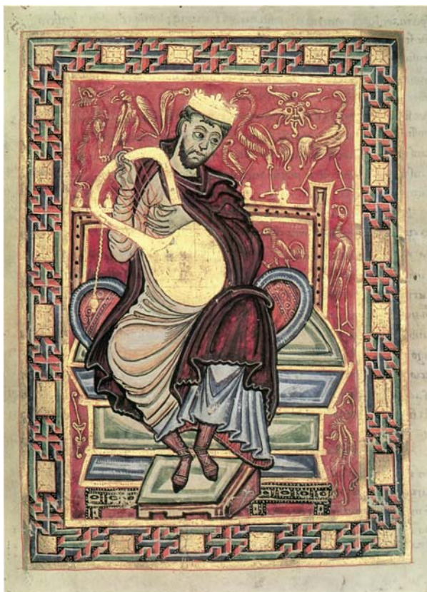
aus dem Egbert-Psalter, 10. Jahrhundert